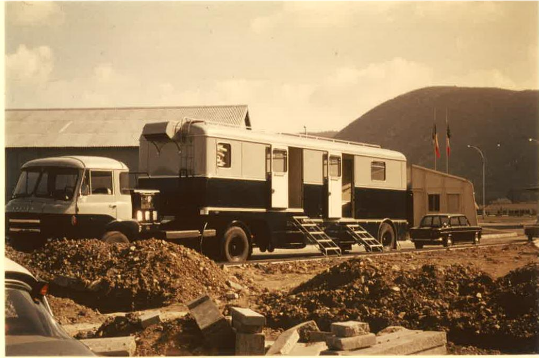
Figure 1 : La première semi-remorque laboratoire du SCPRI comportant un anthropogammamètre et des installations de radiochimie et de dosimétrie photographique, en opération sur le site de Chooz dans les Ardennes. SCPRI, 1967. Archives IRSN.

Ces moyens mobiles d'intervention vont évoluer au tournant des années 1970-1980. A partir de 1974, la France se lance dans un vaste programme nucléaire : le « plan Messmer ». La construction de centrales nucléaires un peu partout sur le territoire impose aux autorités de développer et de mettre à jour leurs moyens mobiles d'intervention en cas d'accident nucléaire. De plus, l'opposition naissante au nucléaire et les discours autour des risques que représente le développement d'un programme nucléaire, poussent les autorités à vouloir rassurer les populations.