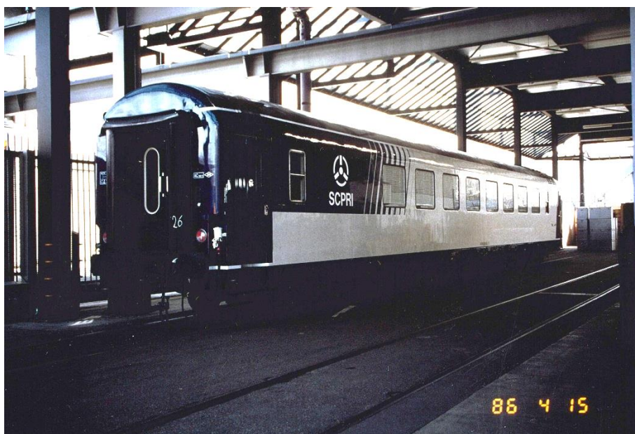
Figure 5 : La voiture rail en avril 1986.

L'équipage de la voiture est composé de 10 à 15 ingénieurs et techniciens suivant le type d'intervention. La voiture rail dispose en outre d'un groupe électrogène autonome pour assurer son alimentation électrique pendant 36 heures en cas de besoin 11 . Elle mesure 24,50 mètres de long pour 3 mètres de large et permet de transporter une charge utile de 18 tonnes. Ses bogies 12 et freins électromagnétiques permettent d'atteindre la vitesse de 200 km/h. Des essais de stabilité à cette vitesse sont réalisés en mars 1986. La voiture rail est stationnée dans un hangar du camp militaire de Satory dans les Yvelines et peut être déployée partout en France, avec le concours de la SNCF.