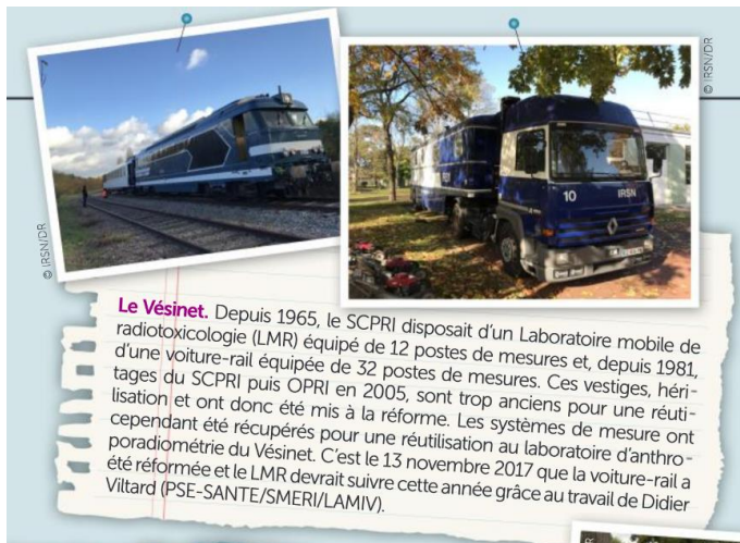
Figure 7 : Article dans le journal interne de l'IRSN "le 12", numéro 25, mars 2018.