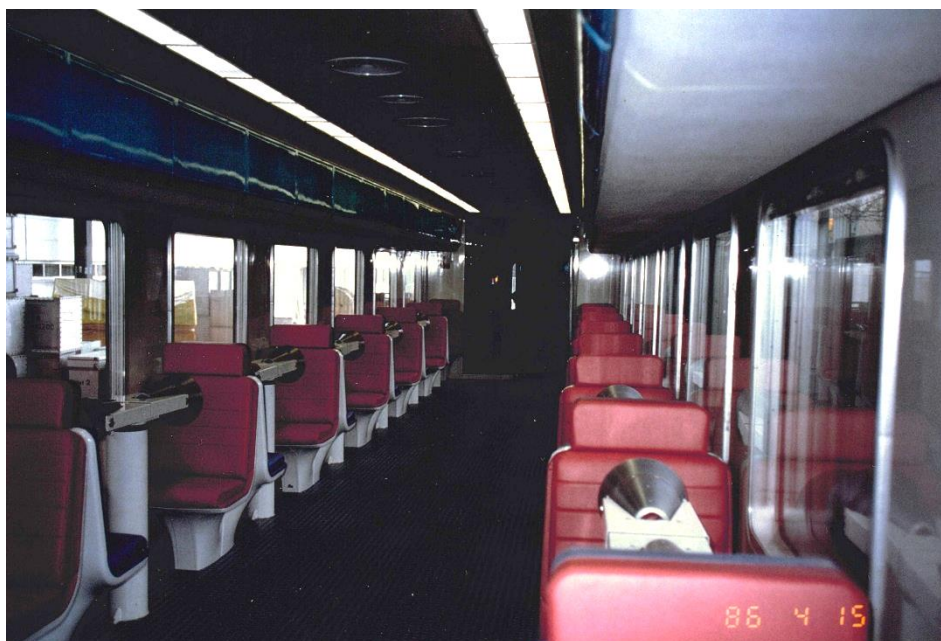
Figure 4 : Intérieur de la voiture rail avec les fauteuils Gémini en avril 1986.

Ainsi, la voiture rail dispose de 32 fauteuils Gémini (qui peuvent être portés à 46 avec une rangée centrale additionnelle) de mesures anthropogammamétriques desservis par 4 spectromètres comportant chacun leurs périphériques et un calculeur à disquette (Figure 4). Ces fauteuils Gémini permettent de vérifier la contamination corporelle d'une personne en quelques minutes avec une cadence de contrôle pouvant atteindre jusqu'à 5000 personnes par jour (ainsi que des échantillons environnementaux grâce à un dispositif additionnel).